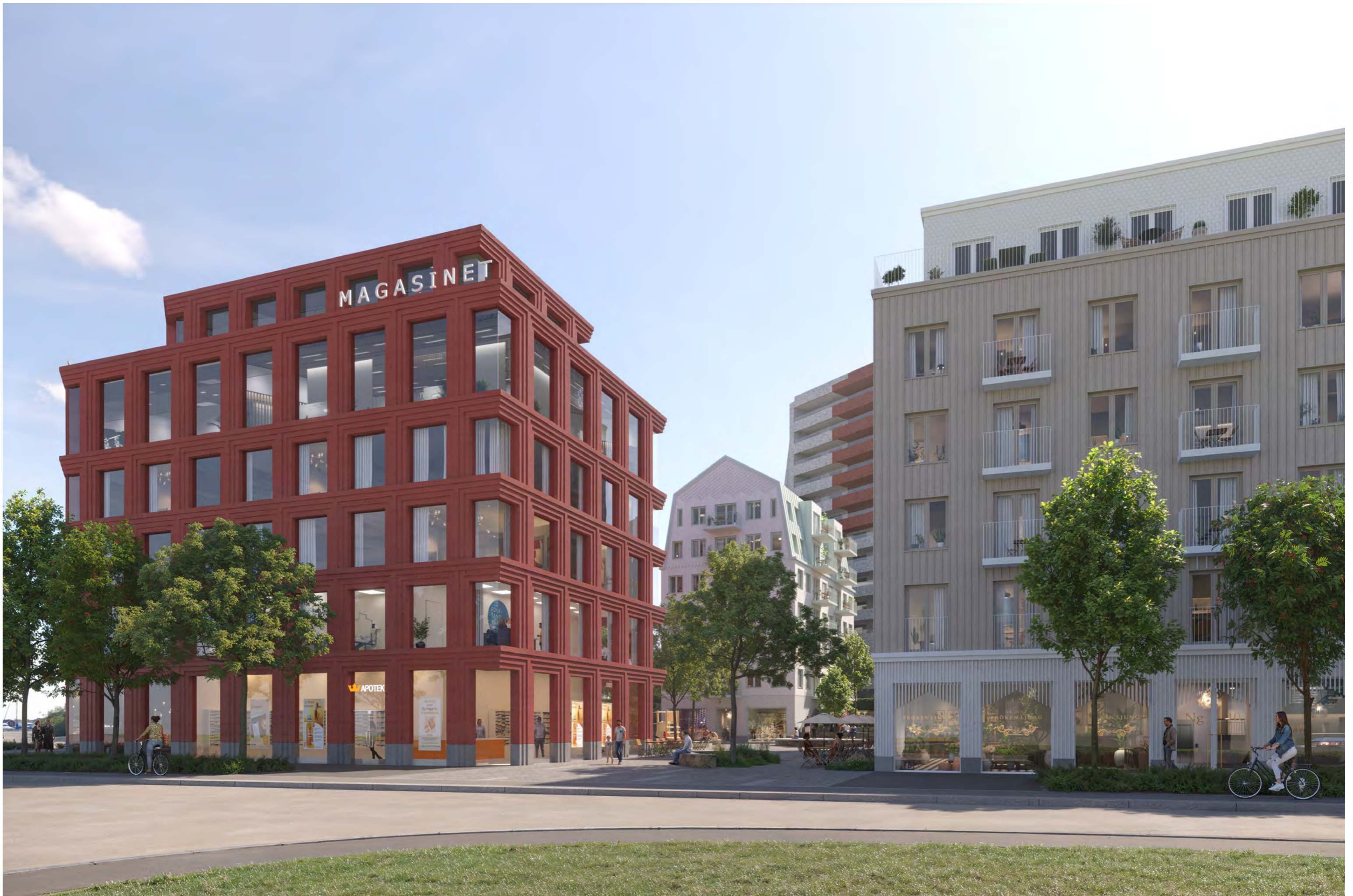
VISIONSBILD FRÅN NORGÅRDSVÄGEN