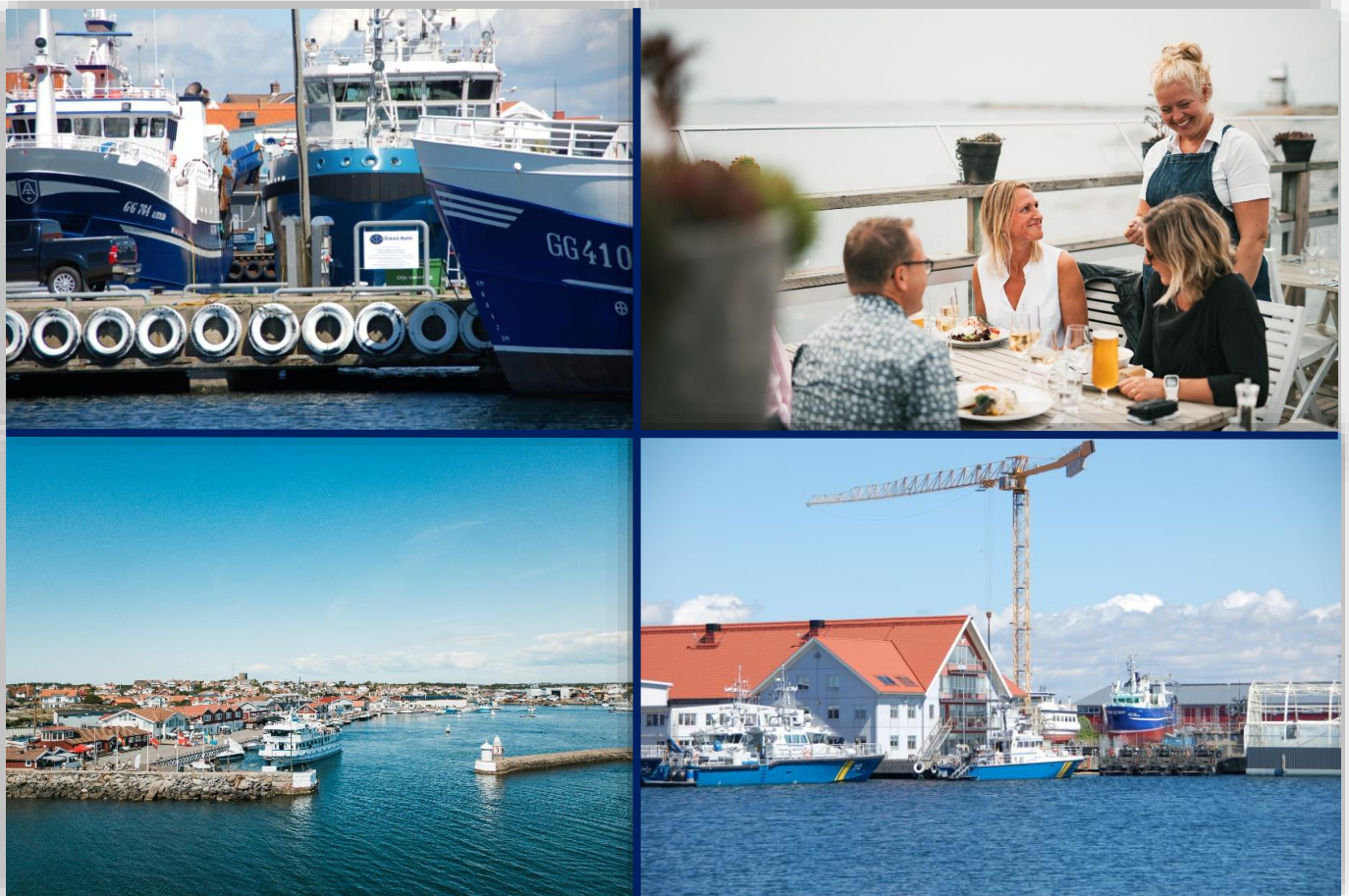
Kollage på 4 bilder som visar hamnar med båtar i kommunen och glada människor sitter på en uteservering.