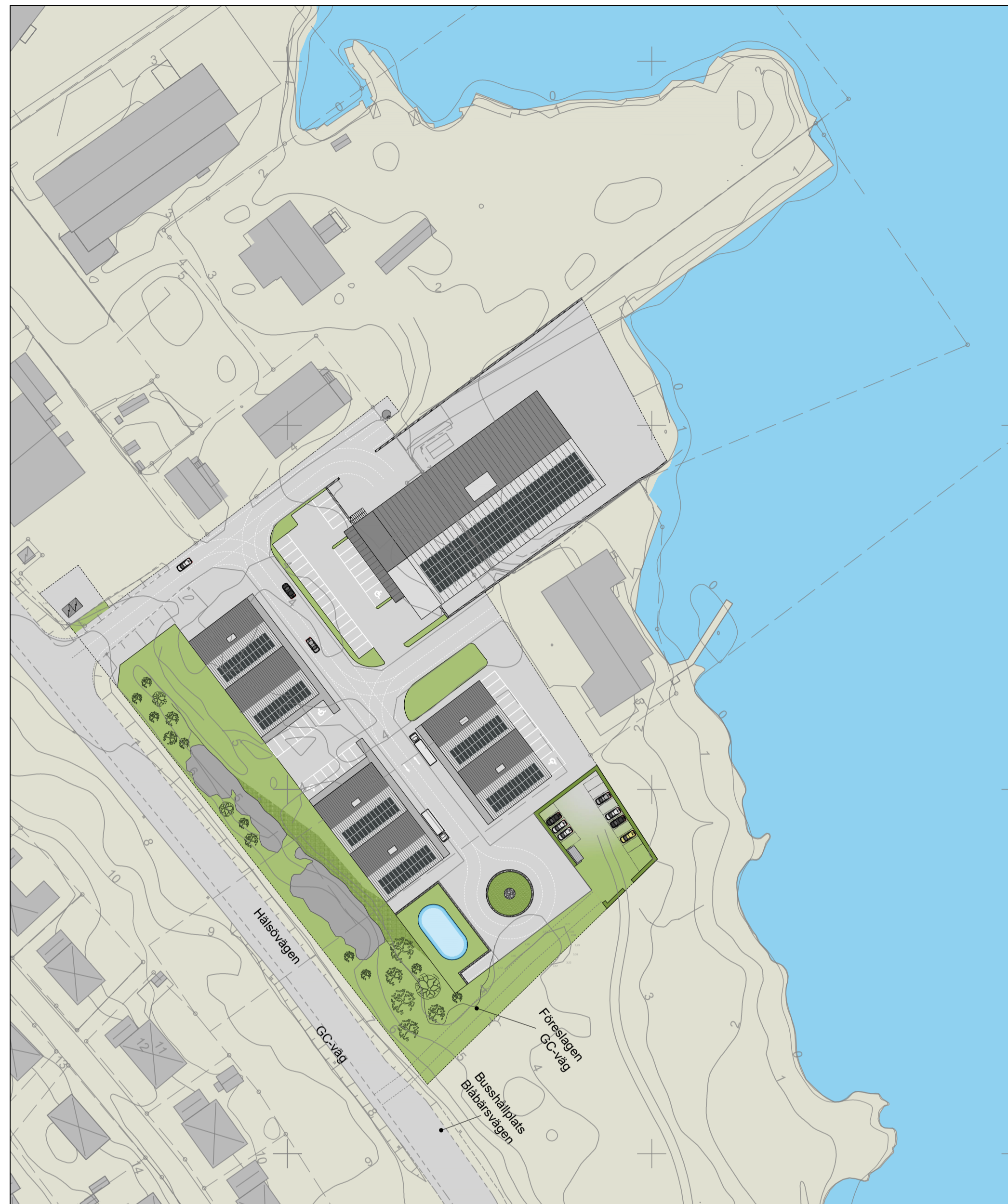
ILLUSTRATION (ej juridiskt bindande)